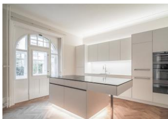
Delsbergerallee (1), Basel