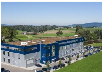
Produktions- und Verwaltungsgebäude, Bronschöfen