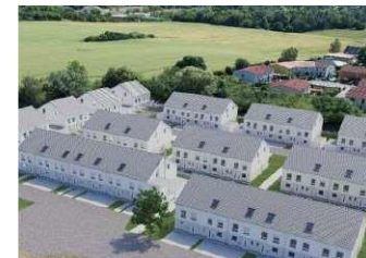
Siedlungsbau Reihenfamilienhäuser, Britz (Deutschland)