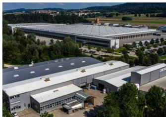
Produktions- und Verwaltungsgebäude, Domdidier