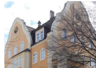
Delsbergerallee (2), Basel