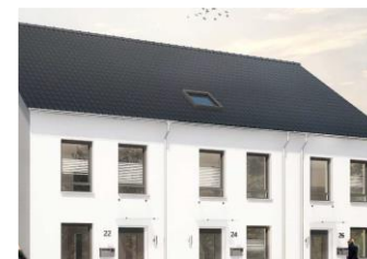
Siedlungsbau Wohnungen, Berlin/Brandenburg (Deutschland)