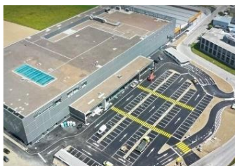
Affoltern am Albis